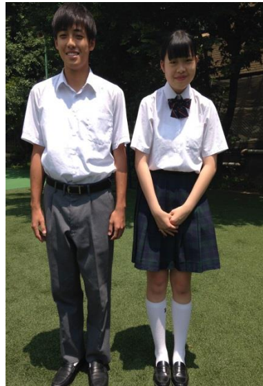
中學部 高中部夏季制服