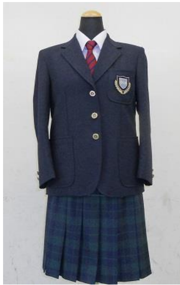
中高女生冬季制服