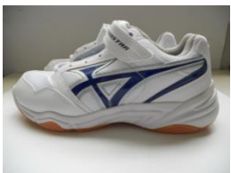
運動鞋（中高年級以上用）