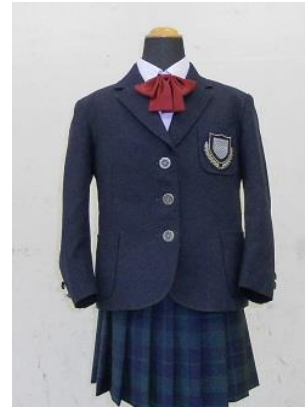
小學女生冬季制服