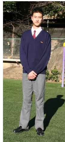
制服毛線衣(全學年)