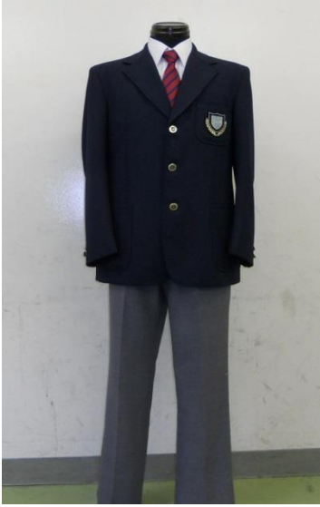
小中高男生冬季制服